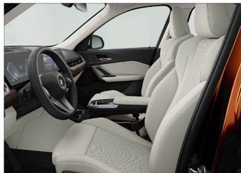
Sensatec 透氣皮質 / 跑車座椅 X1 sDrive20i xLine