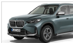
X1 sDrive18i xLine