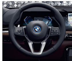
跑車多功能真皮方向盤