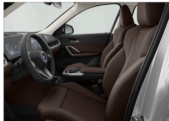
Sensatec 透氣皮質 / 跑車座椅 iX1 xDrive30 xLine