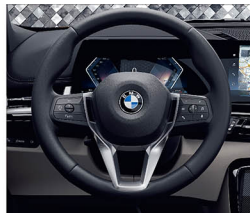
跑車多功能真皮方向盤