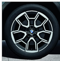
V 輻式 867