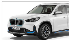
iX1 xDrive30 xLine