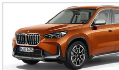
X1 sDrive20i xLine